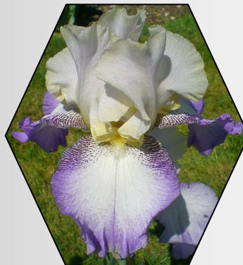
Foggy Dew 1969 Größere Blüten, mehr gerundete breitere Blütenblätter, leichte Rüschen