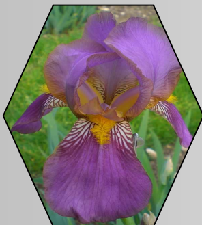
Evadne 1921 Kleine Blüten, schlanke, hängende Blütenblätter