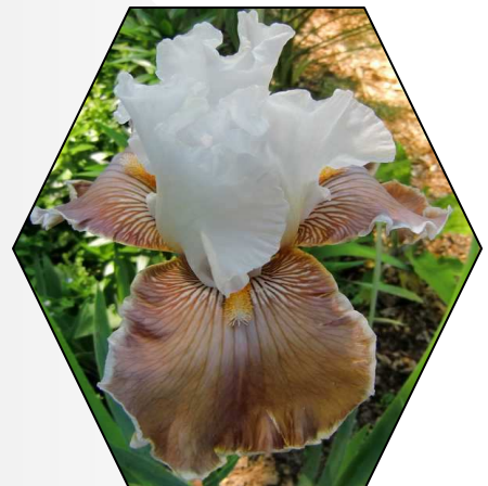
Coffee Whispers 1999 Große Blüten, runde, fast waagrecht stehende Blütenblätter, starke Rüschen